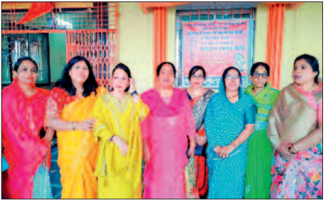
सफल ऑपरेशन के पश्चात उनके अच्छे स्वास्थ्य के लिए सुंदरकांड व सामूहिक हनुमान चालीसा का