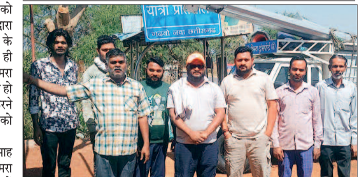
पचास हजार से अधिक का चालान

प्राप्त जानकारी अनुसार नर्मदा में लगे कैमरा से वाहन चालकों को मोटी एवं भारी भरकम चालान कटने की जानकारी है। परिवहन विभाग के मापदण्ड के अनुसार जिन वाहनों में कमी पाया गया उन वाहनों पर 23 सौ से 50 हजार से अधिक तक का चालान काटे जाने की खबर है। वाहन चालकों ने बताया कि एक ही सप्ताह में दो से तीन बार चालान काटा गया है। चालकों ने बताया कि चालान कटने के सप्ताह भर बाद इसकी जानकारी भेजी जाती है। जिससे बकाय के, तीन गुना हो जाता है।