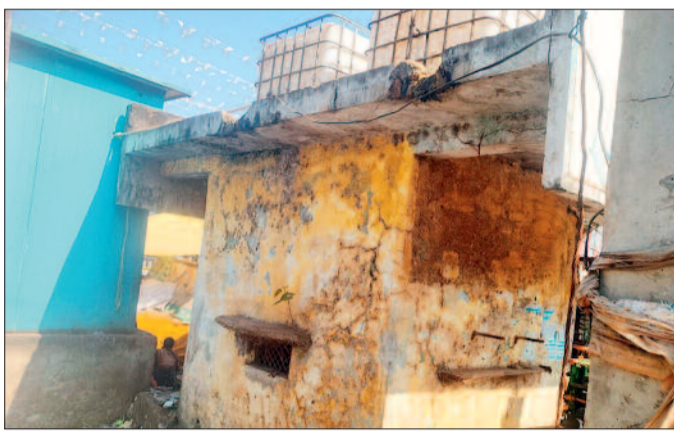
24 घंटे में 2000 लीटर पानी बर्बाद

नगर में निजी बोर खनन की संख्या में बेतहाशा वृद्धि हुई है। वर्तमान में लगभग 30 प्रतिशत से अधिक घरों में निजी बोर हैं। गर्मियों में पानी के अत्यधिक दोहन के कारण कुएँ अभी से सूखने लगे हैं। लोग अपनी जरूरत लायक पानी मरने के बाद हजारों लीटर पानी यूँ ही बहा देते हैं। यही आलम रहा तो आने वाले एक महीने के भीतर निकस के सफरती बोर फेल हो जाएंगे और नगर बूढ़-बूढ़ पानी के लिए त्राहि-त्राहि करने मजबूर होगा।